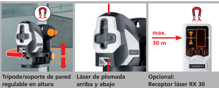
Trípode/soporte de pared regulable en altura