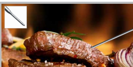
Langer, ausklappbarer Einsteckfühler mit sehr dünner Messspitze