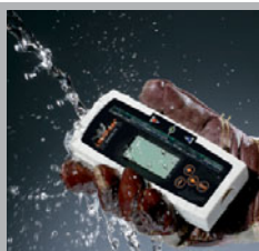
Wasser- und staubgeschützt nach IP 67