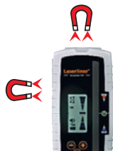
Kopf- und Seitenmagnete