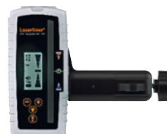
SensoLite 410 Set inklusive Universalhalterung + Batterie