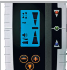
Beleuchtetes LC-Display, superhelle Signal-LED's