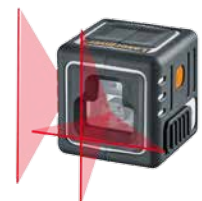
CompactCube-Laser 3 + batterijen

Verpakkingsformaat (B x H x D) 175 x 220 x 138 mm