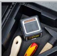
Passend voor iedere gereedschapskist