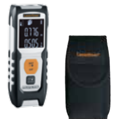
LaserRange-Master i3 inklusive Transporttasche + Batterien (2 x 1,5 V Typ AAA) Verpackungsgröße (B x H x T)

* Bereichsspezifische Genauigkeiten siehe Bedienungsanleitung.