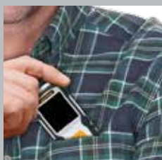
Kleine, kompakte Bauform