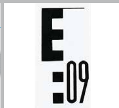
Fernsichtskala mit E-Teilung