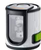
EasyCross-Laser Green + Batterien

Verpackungsgröße (B x H x T) 110 x 235 x 80 mm