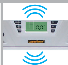
AutoSound bei 0°/45°/90°/135°/180°