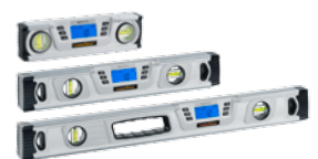
AutoSound bei 0°/45°/90°/135°/180°