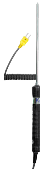
ThermoSensor Tip + Spiralkabel

Verpackungsgröße (B x H x T) 90 x 400 x 30 mm