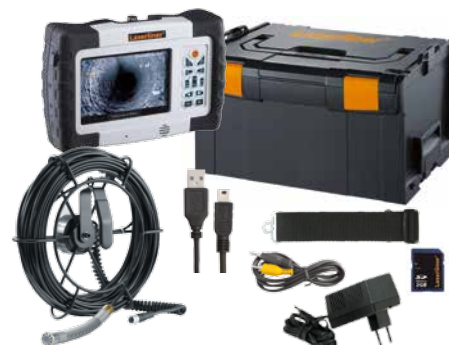
Kamerakopf mit 10 Hochleistungs-LED's