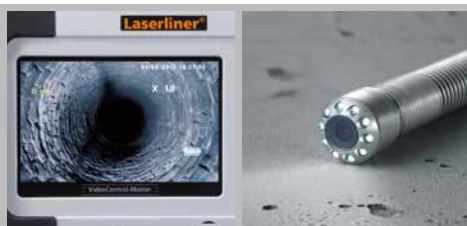
5,0" TFT Farbdisplay