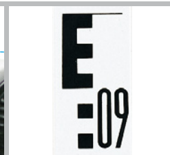
Escala panorámica con división E