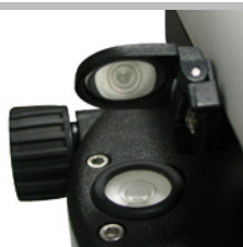
Espejo plegable para la alineación fácil