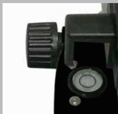
Espejo para facilitar la alineación