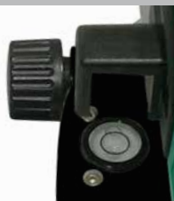
Espejo para facilitar la alineación