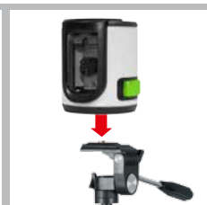
Conexión de rosca 1/4"