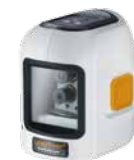
SmartCross-Laser + pilas