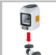
Conexión de rosca 1/4"