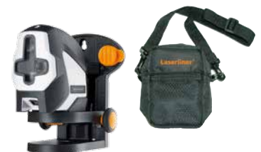
SuperCross-Laser 2P con funda de transporte + trípode/soporte de pared + pilas (4 x tipo AA)