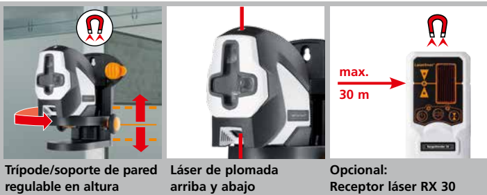
Trípode/soporte de pared regulable en altura