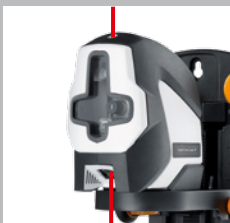
Láser de plomada arriba y abajo