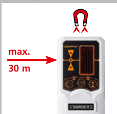
Incluye: Receptor láser RX 30