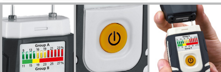
Indicador de húmedo y seco por LEDs de 12 posiciones