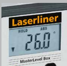
Display luminoso LC