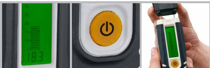
Grande visor LC perceptível