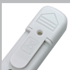
Suporte com clipe